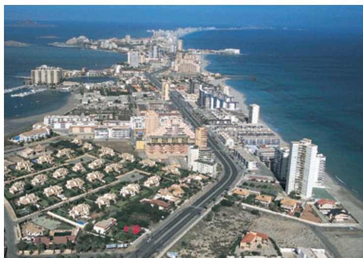
La Manga del Mar Menor.

Es preciso potenciar en la región un turismo respetuoso con el medio ambiente, y hacer compatible el crecimiento económico con el mantenimiento del gran patrimonio natural de la Región de Murcia.